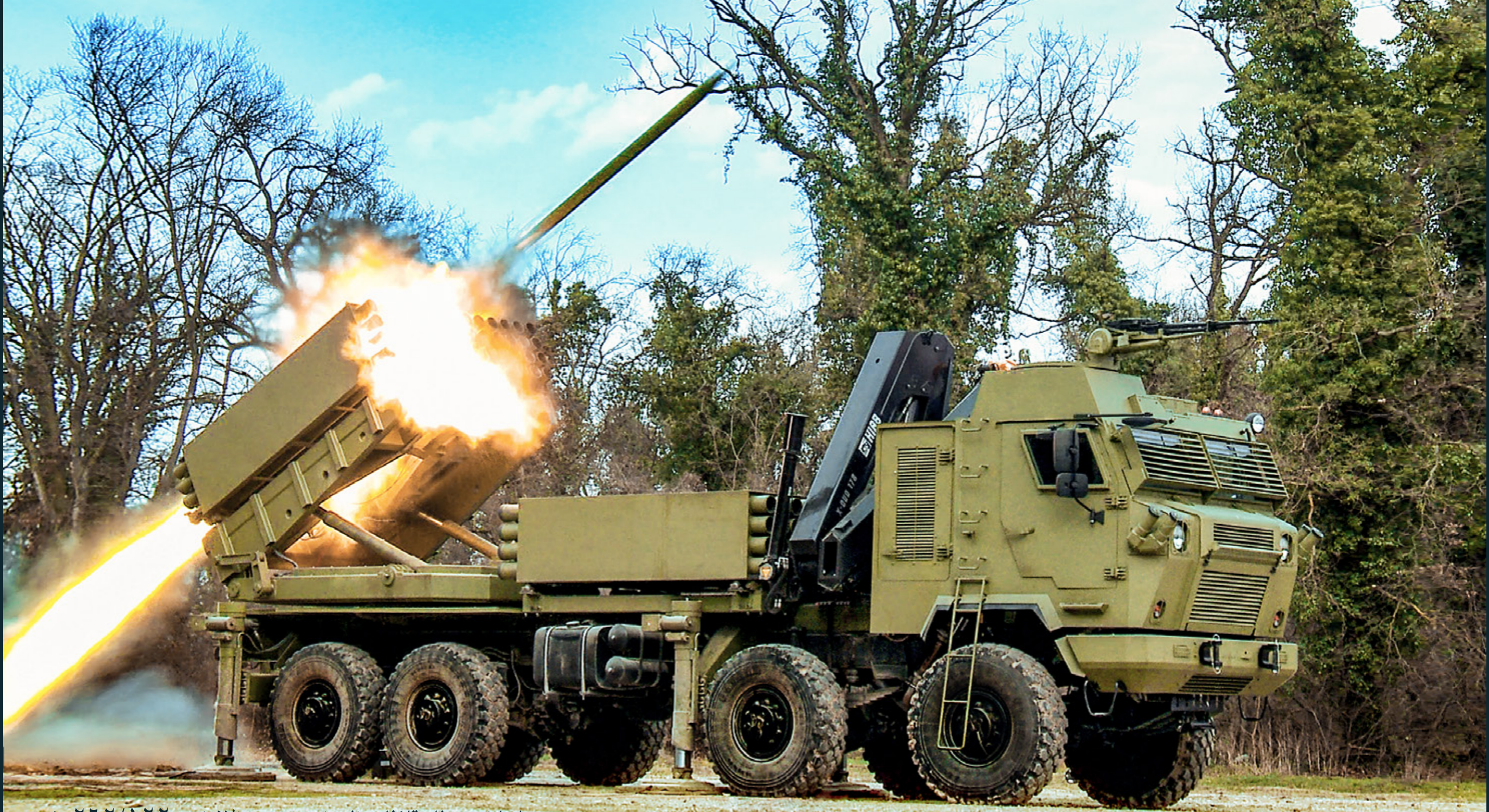
تامناوا - نظام قاذفات الصواريخ متعدد الاغراض ٢٠٢٢/٢٠٢٢ ملم