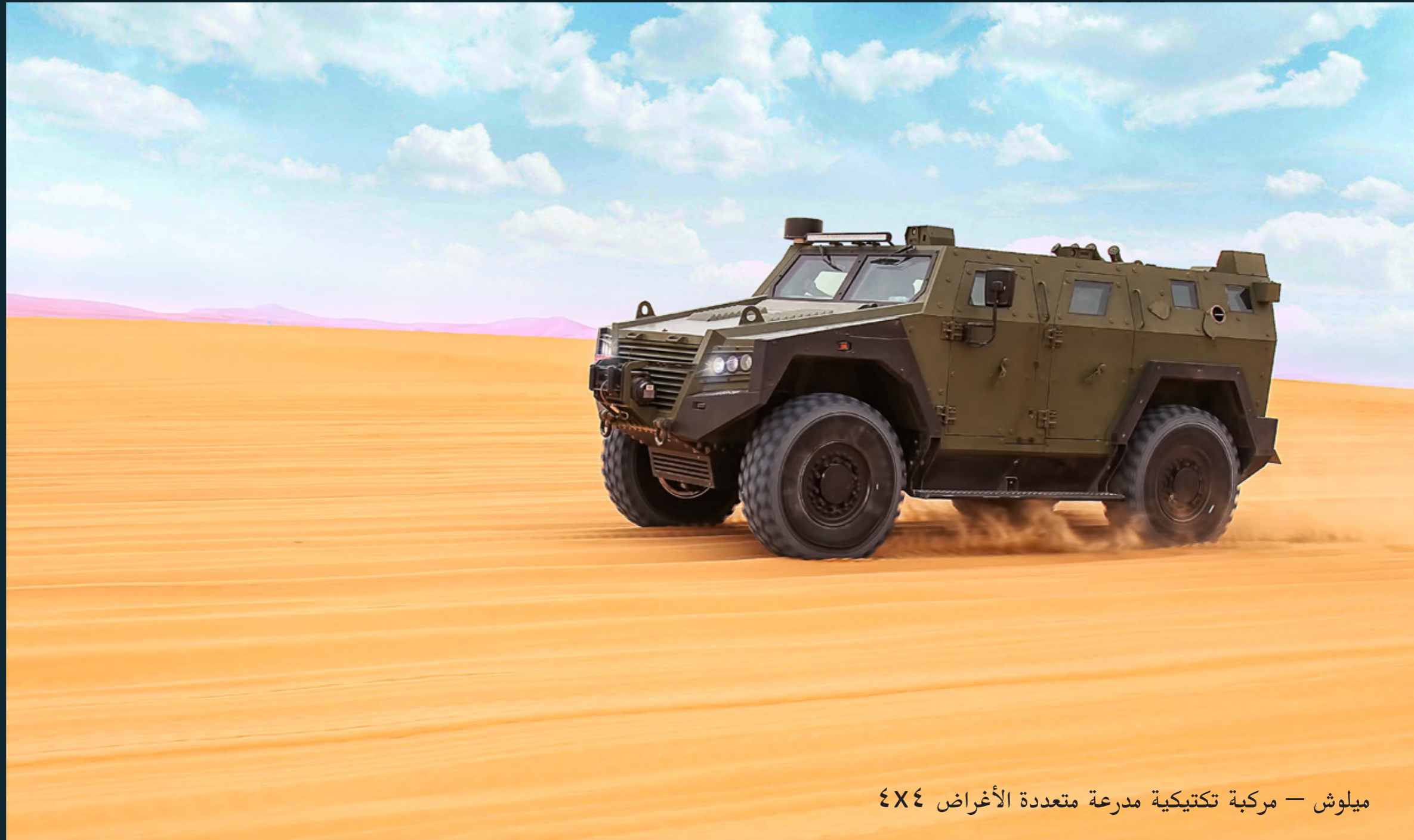
ميلوش — مركبة تكتيكية مدرعة متعددة الأغراض 4X4