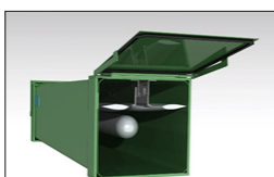
Дрон 145mm в контейнере