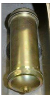
Комбинированная, термобарическая и осколочная боеголовка со стальными шариками 122mm, 13 kg