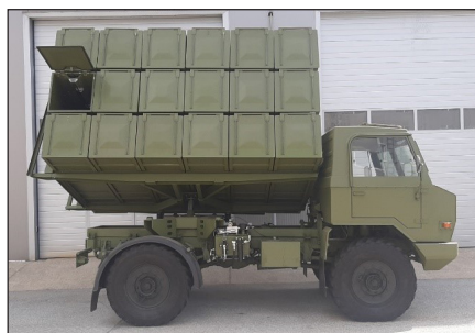
Пушковая установка – грузовик с 24 контейнерами