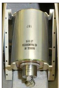
Комбинированная, термобарическая и разрывная боеголовка со стальными шариками 130mm, 10.5kg