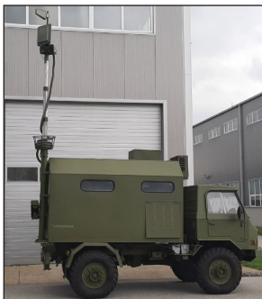
Станция управления с антенной системой