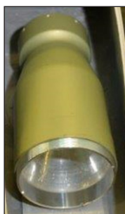
Противотанковая, тандем кумулятивная боеголовка 145mm, 6.4kg