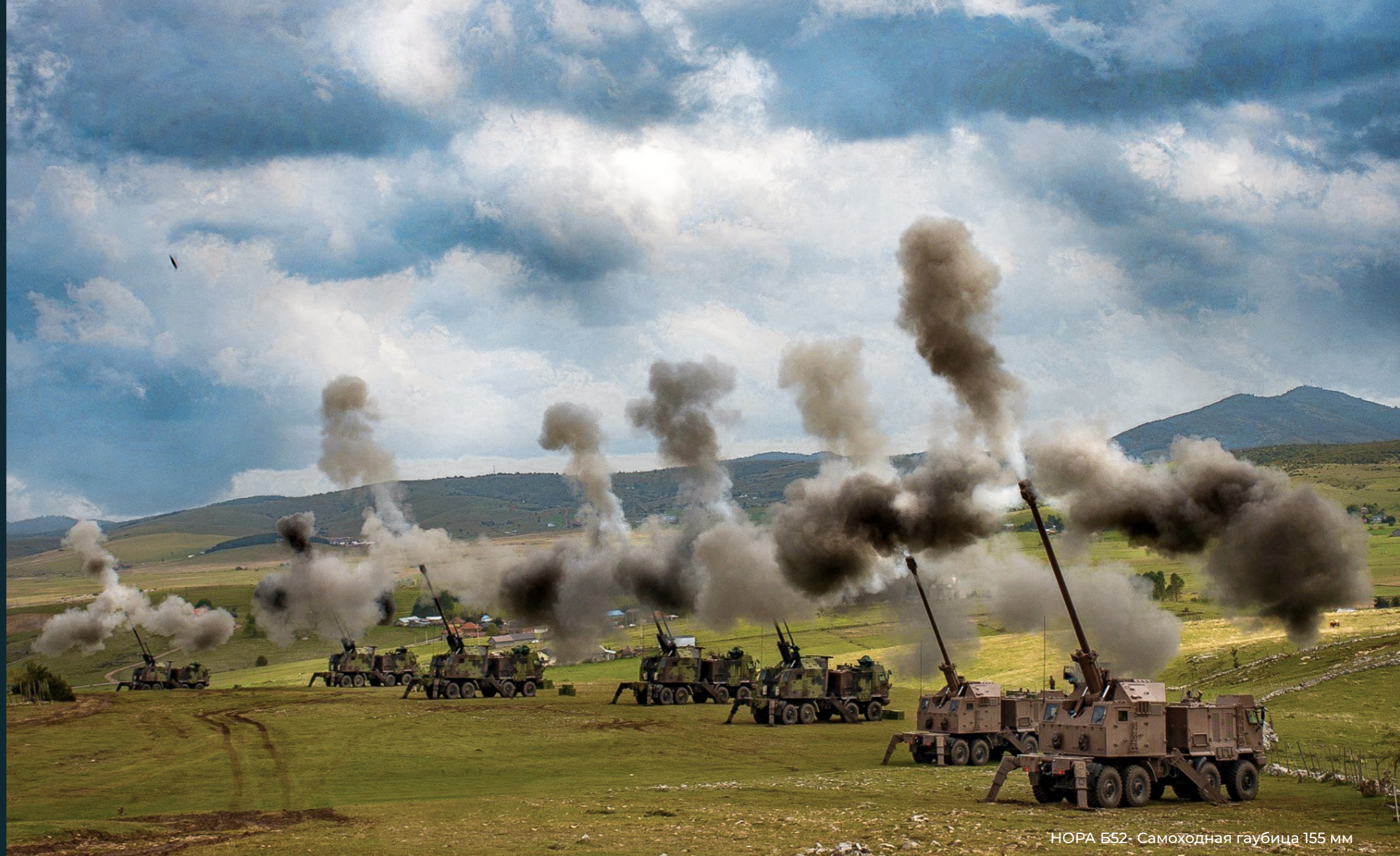
НОРА Б52- Самоходная гаубица 155 мм

Политика качества Государственного предприятия « Жугоимпорт-СДПР » является неотъемлемой частью деловой политики и представляет собой средство менеджмента для осуществления намеченных деловых целей. Тот факт, что уже много лет компания сохраняет за собой сертификат ISO 9001, являющийся общепризнанным доказательством качества компании на международном уровне, ещё раз подтверждает, что « Жугоимпорт-СДПР » при ведении бизнеса применяет современные признанные во всем мире стандарты, и, таким образом, постоянно обеспечивает высокий деловой уровень.