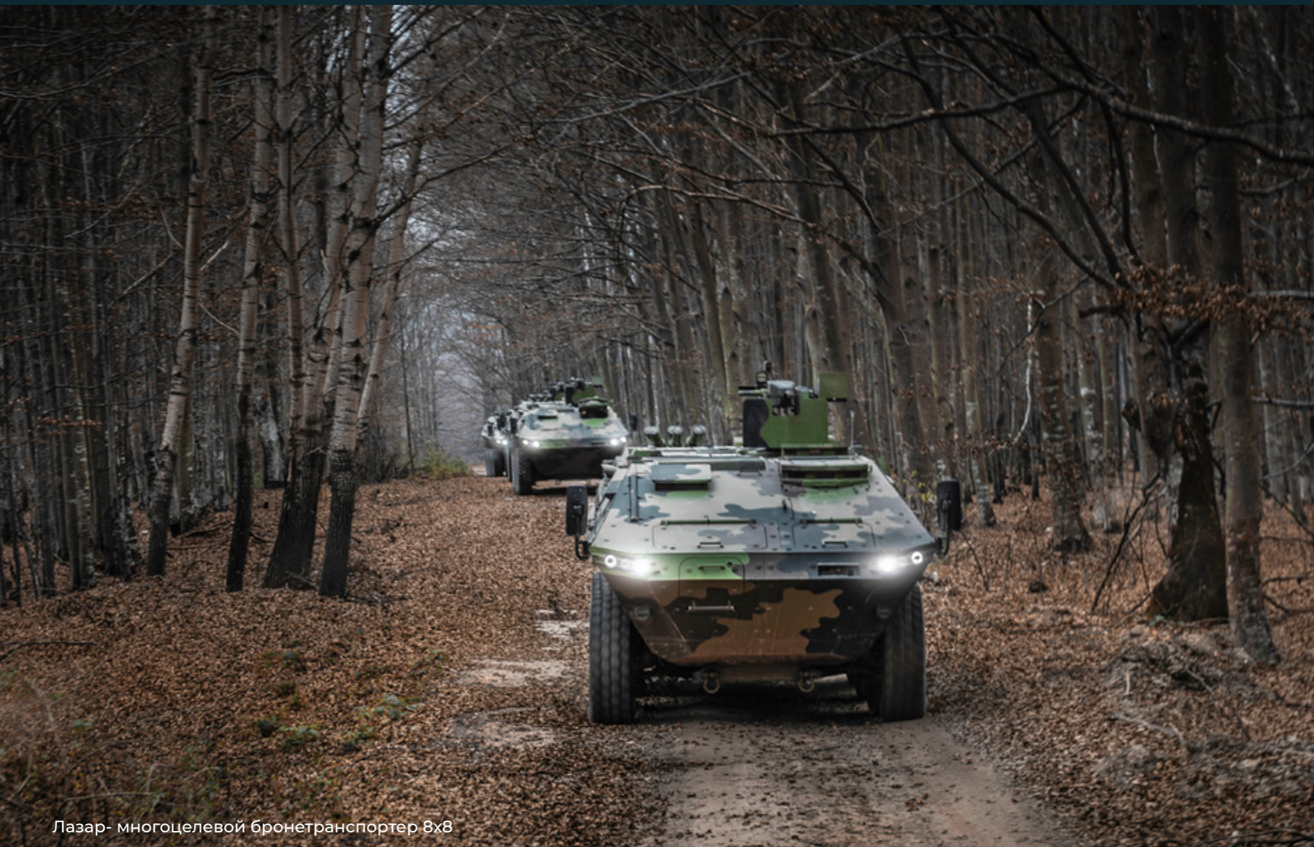
Лазар- многоцелевой бронетранспортер 8x8