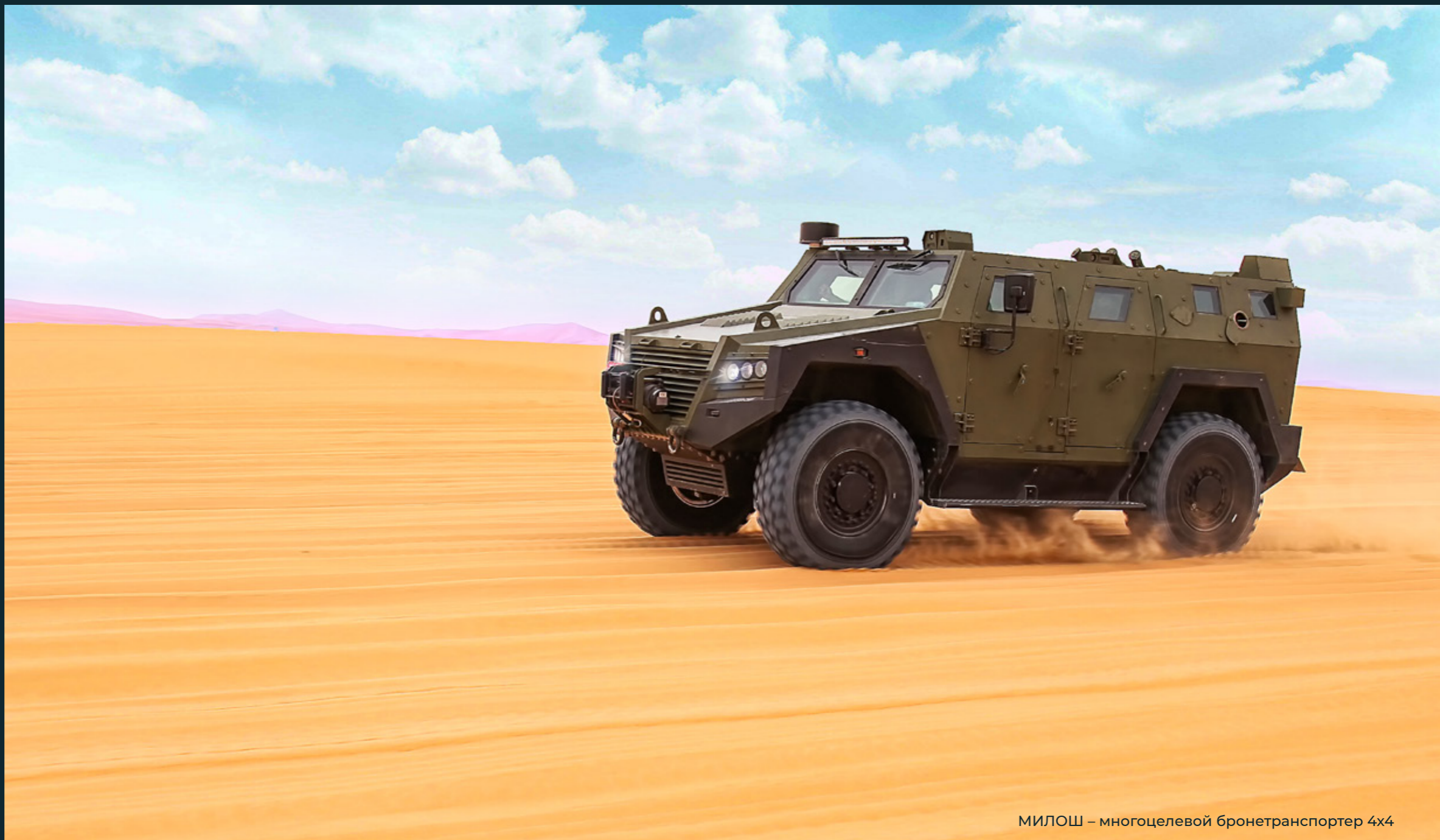
МИЛОШ – многоцелевой бронетранспортер 4x4